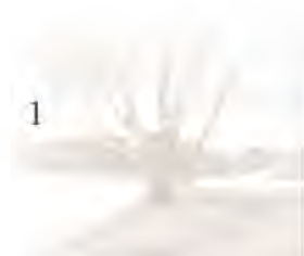
E.J. Roest Plaatsvervangend voorzitter Stichting Gooisch natuurreservaat