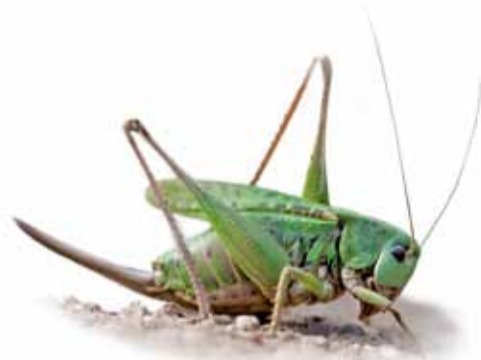
Uitgestorven in het Gooi sinds 1989: de wrattenbijter. Zou heel misschien ooit nog kunnen terugkeren.

Wellicht kent u de veldkrekkel nog uit de fabels van Lafontaine. Maar om een stapje verder het folkloristische pad op te gaan: Wist u dat Zweedse boeren zich vroeger ontdeden van wratten door ze te laten afbijten door sprinkhanen? De stoere sprinkhaansoort die hiertoe in staat bleek, kreeg dan ook de officiële wetenschappelijke naam Decticus verrucivorus , wat zich in het Nederlands laat vertalen als 'wrattenbijter'.