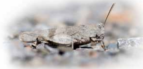
Blauwvleugelsprinkhaan: terug in het Gooi na 15 jaar!